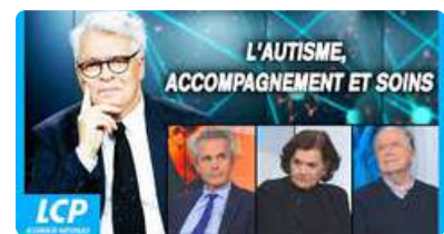
Table ronde réunissant pédopsychiatres universitaires et psychanalystes. Débat sur l'état actuel de la prise en charge des enfants autistes en France.